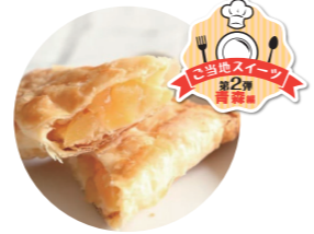
パティシエのりんごスティック