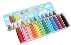
今までの常識を覆すクレヨン「くれびつ」